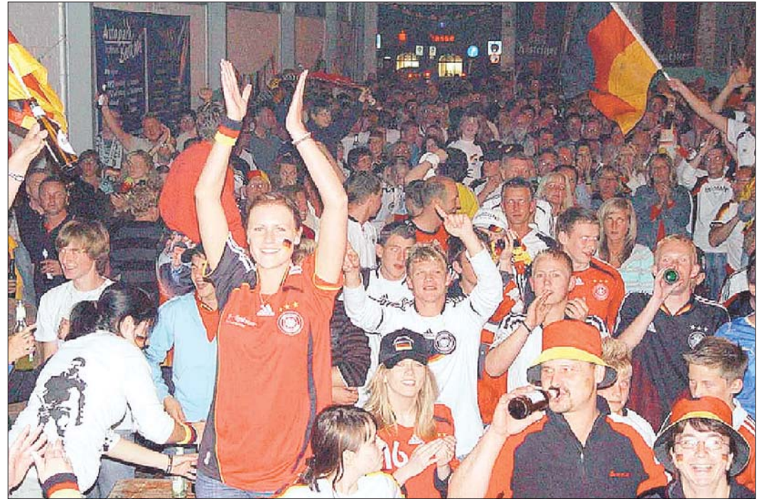
Jeweils zwischen 500 und 800 Menschen besuchten die Public-Viewing-Veranstaltung des Projekts Kunstrasen in der alten Landwarenhalle in Kirchhain und feierten friedlich.

Um den bestehenden Hartplatz des TSV aus eigenen Mitteln in einen modernen Kunstrasenplatz umwandeln, startete der Verein im vergangenen Jahr das Projekt Kunstrasen. Eine eigens gegründete Projektgruppe organisiert seitdem diverse Veranstaltungen, um Geld für das mehrere hunderttausend Euro teure Vorhaben zusammenzubekommen. Das Public Viewing zur Fußball-Europameisterschaft war ein Teil davon, mit dem die Kirchhainer